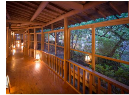
◀2400坪の敷地には、川のせせらぎや四季折々を楽しめる日本庭園。