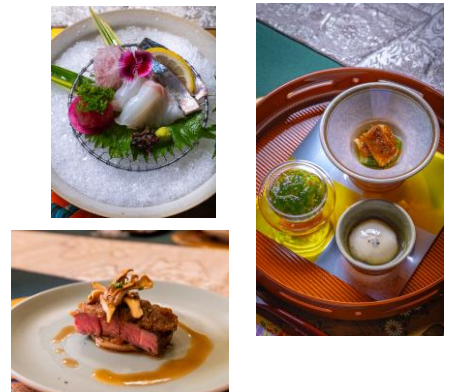
至高の料理とおもてなし 海外から凱旋帰国したシェフが手掛ける九州各地の厳選食材を、手間ひまかけた心に残るお料理でおもてなし