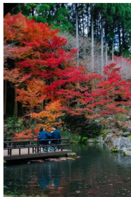
秋は紅葉を見ながらのお食事は格別です

福岡県朝倉市の「秋月温泉 料亭旅館 清流庵」は、小京都・秋月の自然豊かな森に佇む全6室の隠れ家的な高級旅館。全室に専用温泉が付いており、四季折々の庭園を眺めながら、厳選された食材を用いた本格創作料理を堪能でき、贅沢な癒しの時間を過ごせる料亭旅館です。3月SMI採用、4月より後継者育成の社長塾スタート。素晴らしい資質を开花させ、伝統を守りつつ若い感性でどのように進化させていくのか楽しみです。