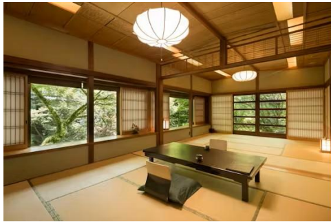
純和風 6室各お部屋と温泉共に個性的で、ゆたいたとした空間