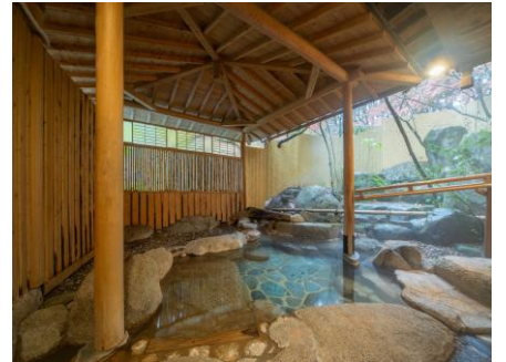
各お部屋に付いた温泉で、気兼ねすることなくゆたいたと名湯に浸れます

女将の思いを形にするため、SMI導入を通じた人材育成を引き続き支援してまいります。