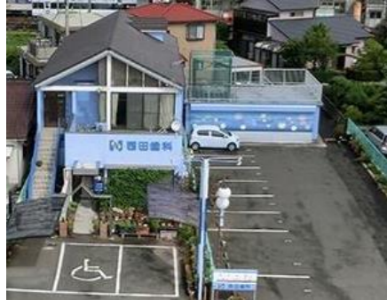
車で来ると来院頂くために15台の広々駐車スペース

わたくしたちN.D.C.は、地域の皆さまのお口の健康をサポートし、皆さまと共に健康長寿を目指します！