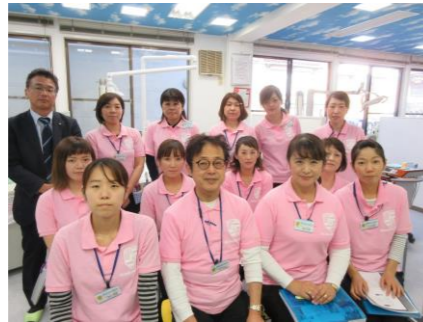
初めてのSMIカンパニー... こんなことするのかな、ドキドキ...