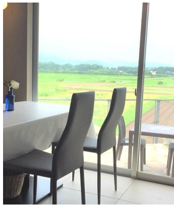
大きな窓からは見渡す限りの美しい田園風景