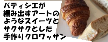
パティシエが編み出すアートのようなスイーツとサクサクとした手作りクロワッサン