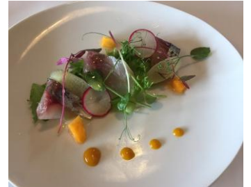
こだわりシェフによる旬の食材を使った季節料理を堪能できる逸品