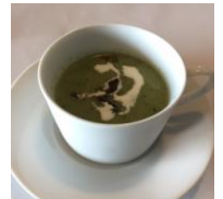
有田焼の器は味覚だけでなく目も楽しませてくれます。